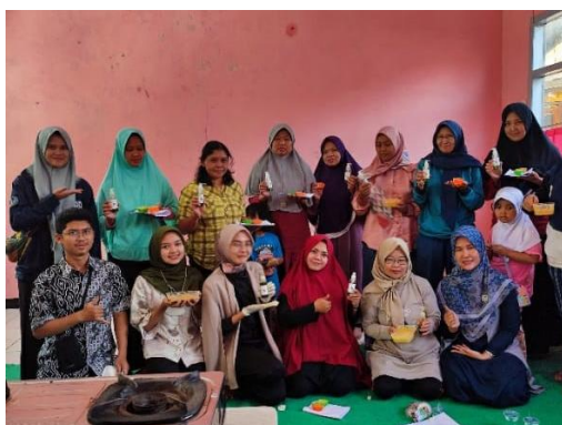
Gambar 3. Hasil kegiatan pelatihan

Pada pembuatan sabun cair antiseptic ditambahkan limbah rumah tangga berupa air cucian beras (Air leri) yang mengandung essential oil untuk melembutkan kulit, antimikroba, dan anti peradangan. Selain itu, air cucian beras juga mengandung vitamin B, C, E dan mineral. Komposisi vitamin ini ampuh untuk melembutkan dan mencerahkan kulit. Air cucian beras telah dimanfaatkan oleh banyak orang untuk perawatan wajah karena kandungan vitamin dan asam lemak esensial yang ada sehingga dapat melembutkan dan mencerahkan kulit. Selain itu pada pembuatan sabun cair juga ditambahkan ekstrak daun sirih yang mengandung saponin, flavonoid, polifenol, dan minyak atsiri serta senyawa antibakteri (Robbia et al., 2021). Senyawa saponin bekerja sebagai antibakteri. Senyawa tersebut akan merusak membran sitoplasma dan membunuh sel. Sedangkan senyawa flavonoid diduga memiliki mekanisme kerja mendenaturasi protein sel bakteri dan merusak membran yang tidak dapat diperbaiki lagi. Penambahan tersebut bertujuan agar sabun cair tersebut dapat digunakan sebagai antibakteri sehingga dapat digunakan sebagai sabun cuci tangan yang melawan virus dan bakteri. Penambahan 2 bahan tersebut yaitu air cucian beras sangat mudah diperoleh karena merupakan limbah rumah tangga yang dihasilkan hamper setiap hari oleh setiap rumah tangga, sedangkan daun sirih dapat ditemukan di sekitar lingkungan karena banyak masyarakat yang menanam daun sirih namun belum dimanfaatkan menjadi produk tertentu.