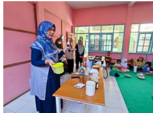
Gambar 2. Sosialisasi Teknik pembuatan sabun

Pada pembuatan sabun cair antiseptic ditambahkan limbah rumah tangga berupa air cucian beras (Air leri) yang mengandung essential oil untuk melembutkan kulit, antimikroba, dan anti peradangan. Selain itu, air cucian beras juga mengandung vitamin B, C, E dan mineral. Komposisi vitamin ini ampuh untuk melembutkan dan mencerahkan kulit. Air cucian beras telah dimanfaatkan oleh banyak orang untuk perawatan wajah karena kandungan vitamin dan asam lemak esensial yang ada sehingga dapat melembutkan dan mencerahkan kulit. Selain itu pada pembuatan sabun cair juga ditambahkan ekstrak daun sirih yang mengandung saponin, flavonoid, polifenol, dan minyak atsiri serta senyawa antibakteri (Robbia et al., 2021). Senyawa saponin bekerja sebagai antibakteri. Senyawa tersebut akan merusak membran sitoplasma dan membunuh sel. Sedangkan senyawa flavonoid diduga memiliki mekanisme kerja mendenaturasi protein sel bakteri dan merusak membran yang tidak dapat diperbaiki lagi. Penambahan tersebut bertujuan agar sabun cair tersebut dapat digunakan sebagai antibakteri sehingga dapat digunakan sebagai sabun cuci tangan yang melawan virus dan bakteri. Penambahan 2 bahan tersebut yaitu air cucian beras sangat mudah diperoleh karena merupakan limbah rumah tangga yang dihasilkan hamper setiap hari oleh setiap rumah tangga, sedangkan daun sirih dapat ditemukan di sekitar lingkungan karena banyak masyarakat yang menanam daun sirih namun belum dimanfaatkan menjadi produk tertentu.