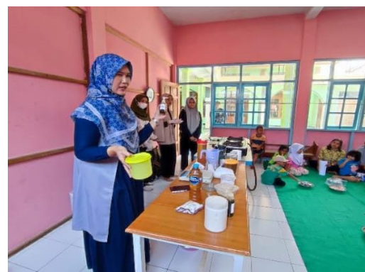
Gambar 4. Pengolahan Sabun

Hasil dari kegiatan pelatihan ini adalah: