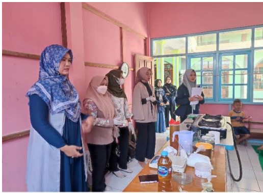
Gambar 1. Sosialisasi efek negative minyak

Sabun merupakan senyawa natrium atau kalium dengan asam lemak dari minyak nabati atau lemak hewani berbentuk padat, lunak atau cair dan berbusa. Sabun dihasilkan dari proses saponifikasi yaitu hidrolisis lemak menjadi asam lemak dan gliserol dalam kondisi basa (Setiawati et al., 2022). Pembuatan kondisi basa yang biasa digunakan adalah Natrium Hidroksida (NaOH) dan Kalium Hidroksida (KOH). Jika basa yang digunakan adalah NaOH, maka produk yang dihasilkan berupa sabun padat, sedangkan jika basa yang digunakan berupa KOH maka produk yang dihasilkan berupa sabun cair (Lilis Sukeksi et al., 2017). Pada kegiatan pelatihan ini dihasilkan 2 jenis sabun yaitu sabun padat untuk mencuci dan sabun cair antiseptic untuk mencuci tangan.