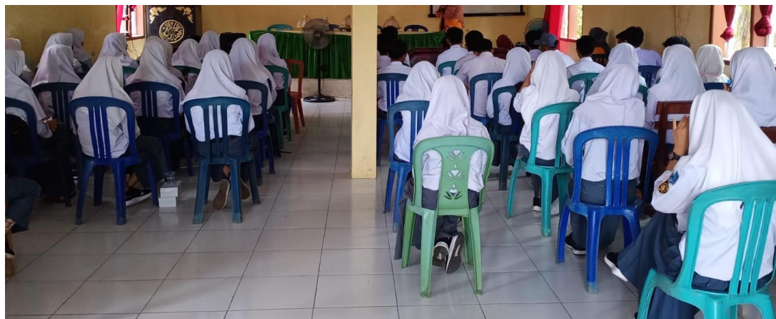
Gambar 1. Suasana ceramah di SMA Negeri 9 Takalar