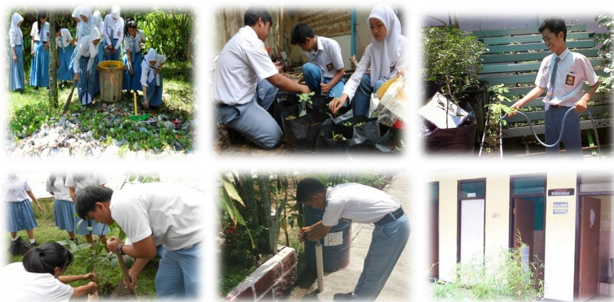
Gambar 3. Contoh Sikap Peserta didik Menjaga Lingkungan

Setelah ceramah dan diskusi dilanjutkan dengan demonstrasi dan praktek tentang bentuk sikap ramah lingkungan. Secara teoritis, manfaat dari PKM ini dapat menggambarkan dan memberikan masukan dalam pelaksanaan pendidikan karakter peduli lingkungan. Secara Praktis: 1) bagi kepala sekolah: memberikan masukan mengenai pentingnya penanaman pendidikan karakter bagi siswa. 2) bagi guru: memberikan masukan kepada guru dalam menerapkan nilai pendidikan karakter peduli lingkungan kepada siswa, dan memberikan motivasi kepada guru untuk mengintegrasikan nilai-nilai karakter peduli lingkungan dalam pembelajaran. 3) bagi siswa: dapat memberikan informasi kepada siswa tentang pentingnya pendidikan karakter peduli lingkungan, dan meningkatkan motivasi siswa dalam mengimplementasikan nilai pendidikan karakter peduli lingkungan dalam kehidupan sehari-hari.