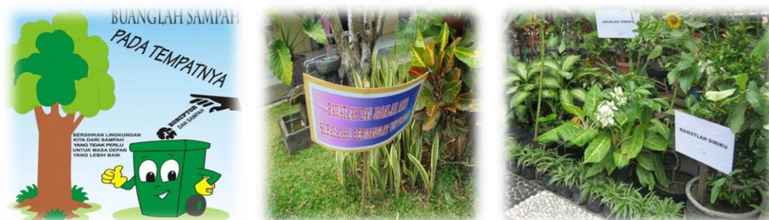
Gambar 4. Poster yang bersifat mengajak untuk menjaga kebersihan lingkungan sekolah

kurikulum berbasis lingkungan; (b) pendidikan berbasis komunitas; (c) peningkatan kualitas lingkungan sekolah dan sekitarnya; (d) sistem pendukung yang ramah lingkungan; dan (e) manajemen sekolah berwawasan lingkungan.