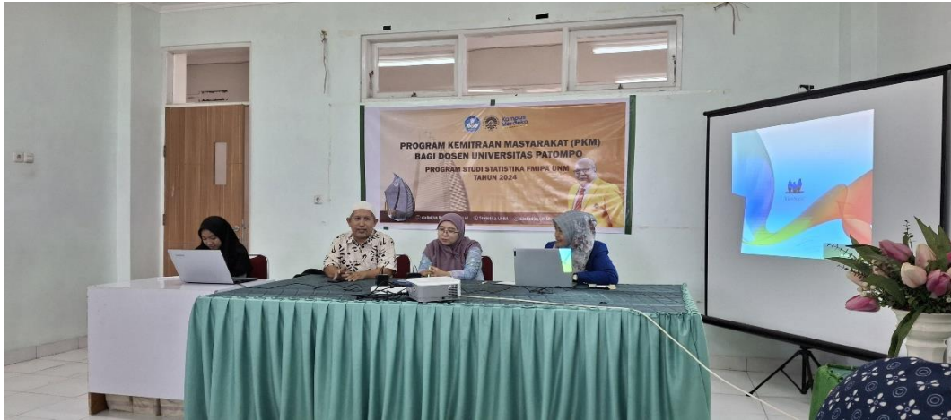
Figure 1. Pembukaan PKM dihadiri oleh Wakil Rektor 1 dan Ketua LP2M Universitas Patempo