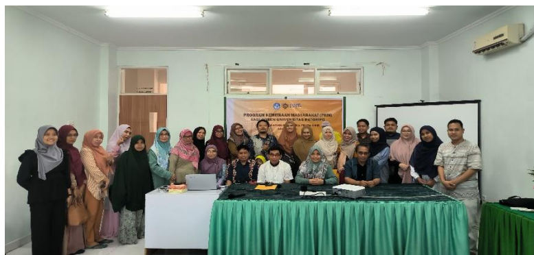
Figure 3. Foto Bersama setelah dilaksanakannya PKM

Peserta merasakan peningkatan dalam hal keterampilan teknis dan kepercayaan diri dalam menggunakan Jamovi untuk penelitian mereka. Beberapa peserta menyarankan untuk mengadakan pelatihan lanjutan dengan fokus pada model SEM yang lebih kompleks serta penggunaan data yang lebih variatif.