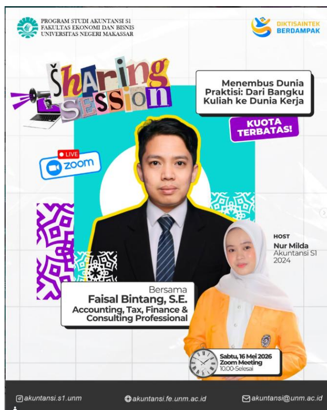
Gambar 1. Flyer Kegiatan

Pemilihan platform Zoom Meeting didasarkan pada kemudahan akses bagi seluruh mahasiswa, kemampuan menampung peserta dalam jumlah memadai, serta ketersediaan fitur interaktif seperti chat , raise hand , dan breakout room yang mendukung keterlibatan peserta secara aktif. Kegiatan dilaksanakan secara live streaming sehingga peserta dapat berinteraksi langsung dengan narasumber secara real-time.