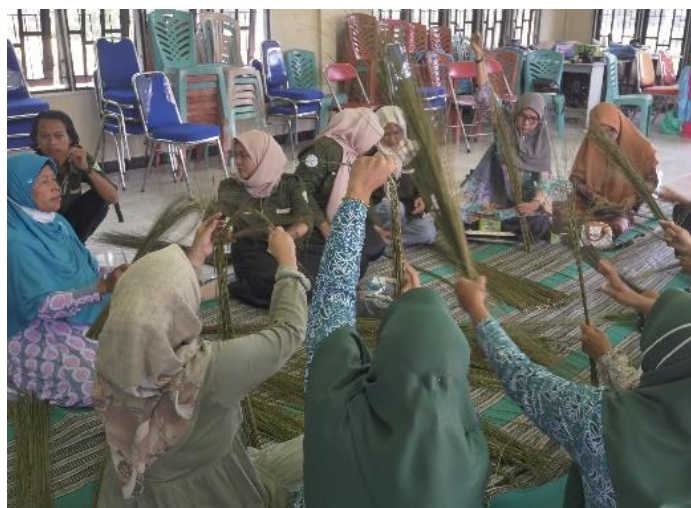
Gambar 3. Demonstrasi dan pelatihan produk kerajinan piring lidi sawit

Dengan adanya perkebunan sawit yang luas, Desa Bukit Payung memiliki limbah pelepah sawit yang cukup banyak. Biasanya pelepah sawit hanya digunakan sebagai sapu, dibuang begitu saja, dan ada juga masyarakat yang membersihkan lidi sawit untuk diperjualbelikan. Dari situasi ini, pelatihan pemanfaatan lidi sawit menjadi ide yang bagus untuk digunakan pada Desa Bukit Payung. Pelatihan ini dilaksanakan di Balai Desa Bukit Payung yang bertemakan “Pelatihan Pemanfaatan Lidi Sawit Menjadi Kerajinan Piring” dihadiri sebanyak 12 orang, diantaranya hadirnya ibu PKK, pengepul lidi sawit dan ibu-ibu sekitar Bukit Payung. Dalam pelatihan ini, dihadiri oleh 2 orang pemateri yang akan membimbing selama proses pelatihan.