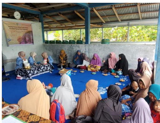
Gambar 5. Demonstrasi dan pelatihan pembuatan produk Be Ice