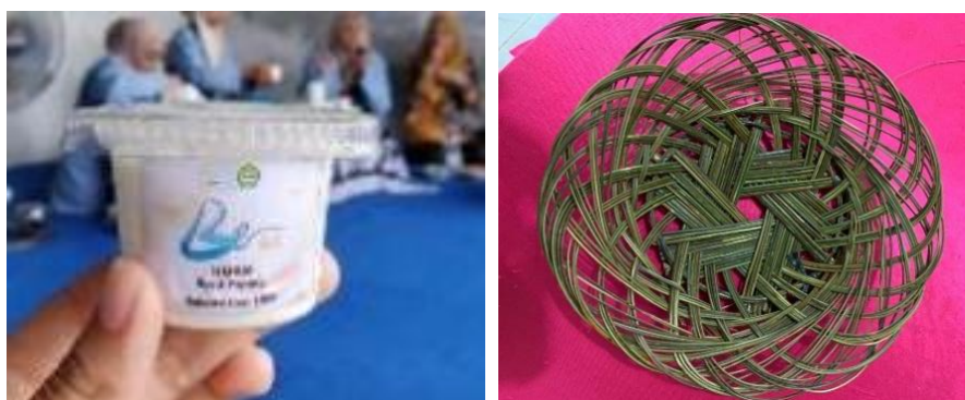
Gambar 6. (a) Produk Be Ice (b) Produk Piring Lidi