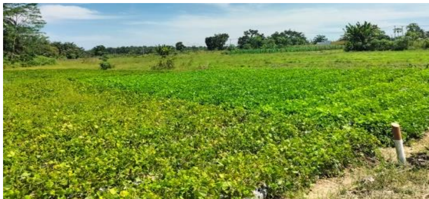
Gambar 4. Potensi perkebunan bengkuang di Desa Bukit Payung

anak. Dan masyarakat bisa mengolah bengkuang menjadi suatu hal yang dapat meningkatkan keuntungan bagi masyarakat dan desa. Produk ice cream ini diharapkan dapat menjadi produk dari program OVOP , sebab belum ada desa lain yang menghasilkan ice cream dari bengkuang. Ini akan menjadi sebuah keunggulan bagi desa dan masyarakat.